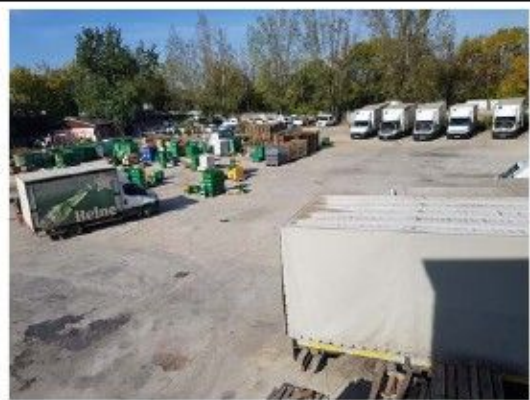
Incinta proprietate, constructii speciale – platforma betonata, imprejmuire