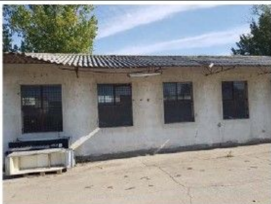
Cladire C5 – Ateliere, depozit