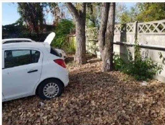
Incinta proprietate, constructii speciale – platforma betonata, imprejmuire