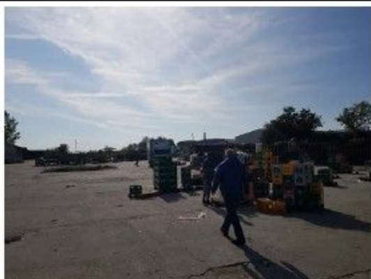
Incinta proprietate, constructii speciale – platforma betonata, imprejmuire