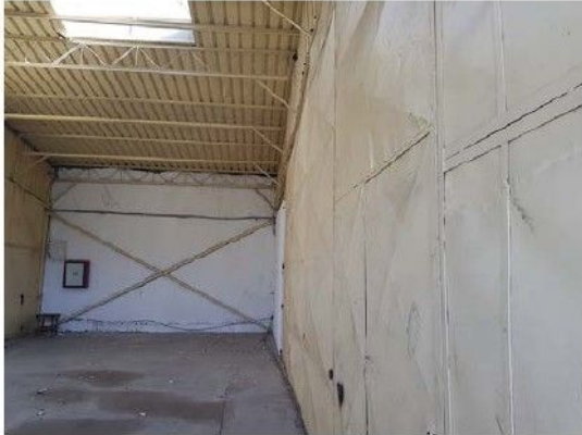
Cladire C3 – Ateliere, depozit