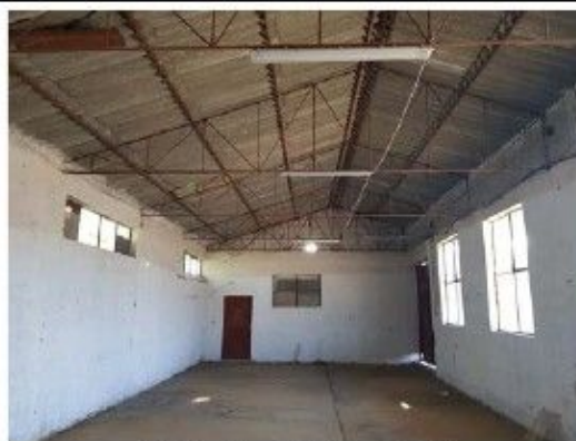
Cladire C5 – Ateliere, depozit