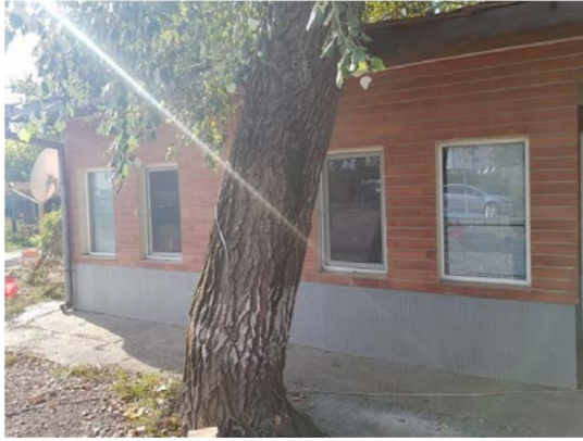
Cladire C1 - Birouri