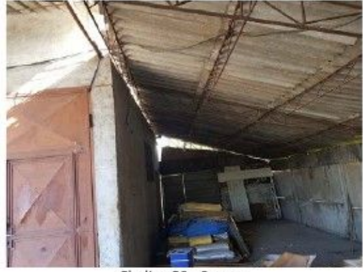
Cladire C6 - Sopron