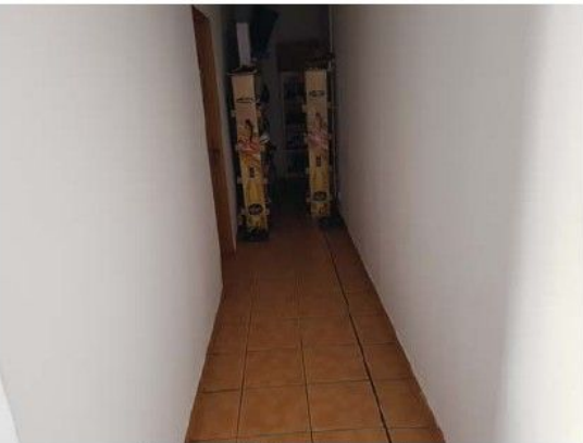
Cladire C1-Birouri; interioare