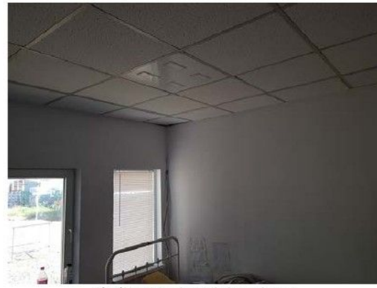
Cladire C1-Birouri; interioare