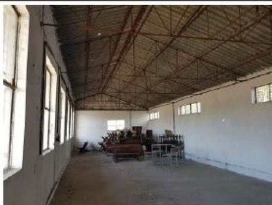
Cladire C5 – Ateliere, depozit