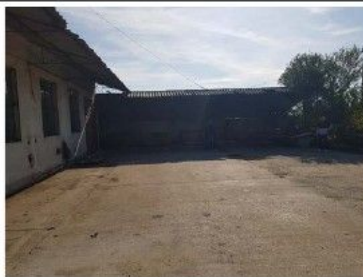
Cladire C6 - Sopron