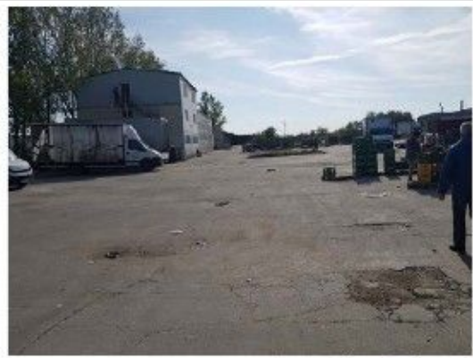
Incinta proprietate, constructii speciale – platforma betonata, imprejmuire