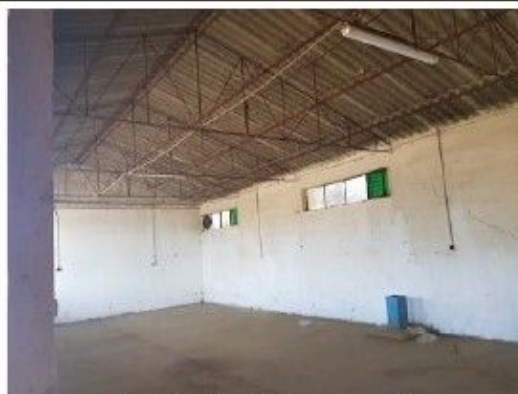
Cladire C5 – Ateliere, depozit