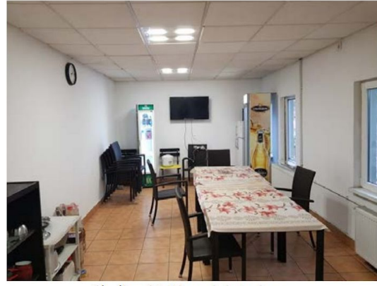
Cladire C1-Birouri; interioare