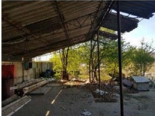
Cladire C6 - Sopron