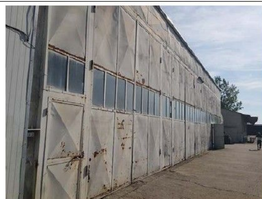
Cladire C3 – Ateliere, depozit