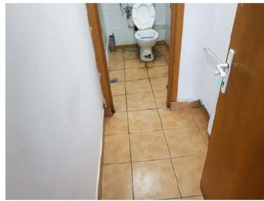
Cladire C1-Birouri; interioare