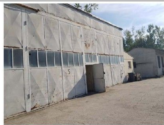
Cladire C3 – Ateliere, depozit