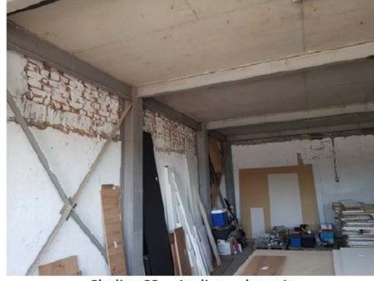
Cladire C3 – Ateliere, depozit