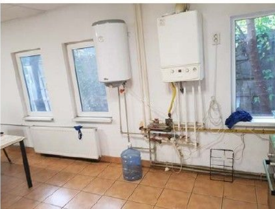
Cladire C1-Birouri; interioare