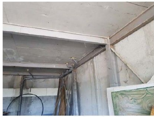
Cladire C3 – Ateliere, depozit