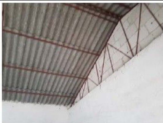
Cladire C5 – Ateliere, depozit