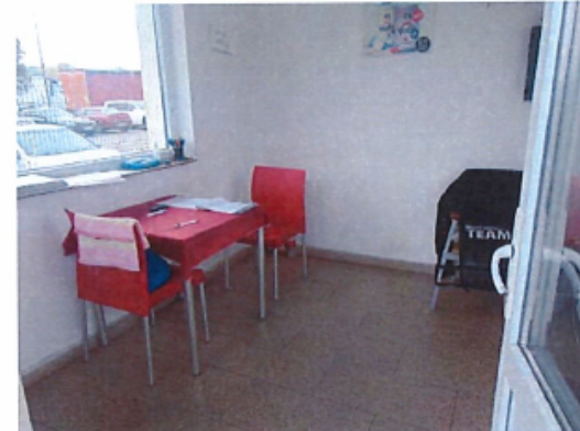
Cladire C3 – Cabina poarta