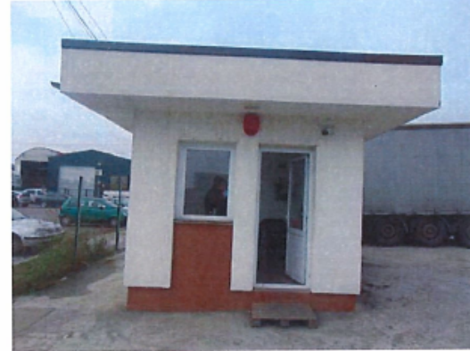
Cladire C3 – Cabina poarta