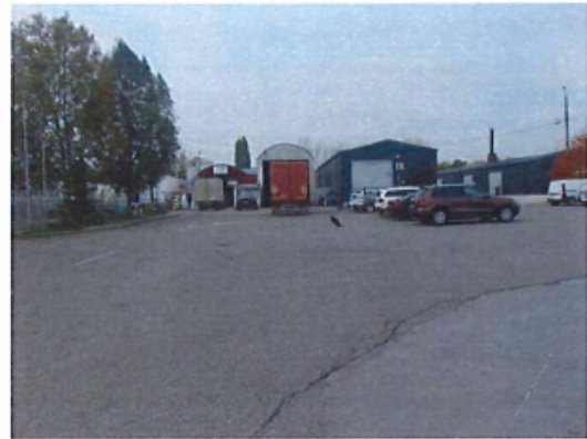
Constructii speciale: platforma betonata si imprejmuiri