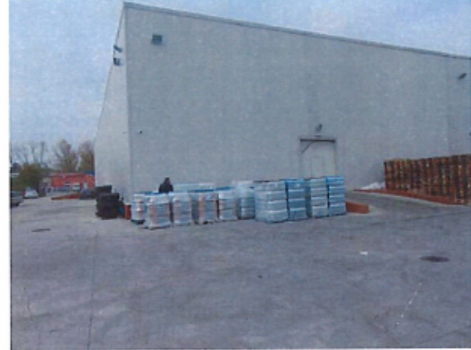
Cladire C2 – Depozit parter