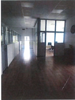
Cladire C1, Depozit parter si spatii birouri P+1