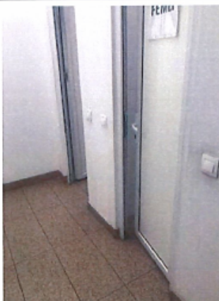
Cladire C1, Depozit parter si spatii birouri P+1