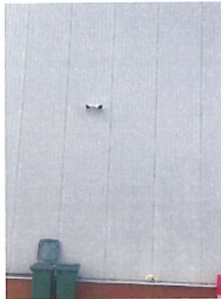
Cladire C2 – Depozit parter