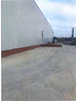
Cladire C2 – Depozit parter