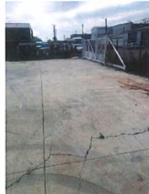
Constructii speciale: platforma betonata si imprejmuiri