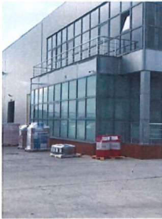
Cladire C1, Depozit parter si spatii birouri P+1