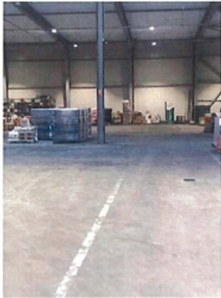
Cladire C1, Depozit parter si spatii birouri P+1