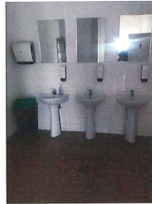
Cladire C1, Depozit parter si spatii birouri P+1