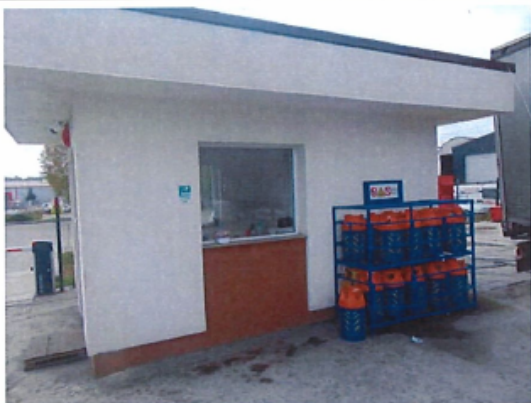
Cladire C3 – Cabina poarta