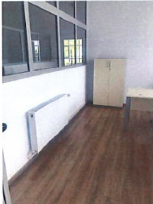
Cladire C1, Depozit parter si spatii birouri P+1