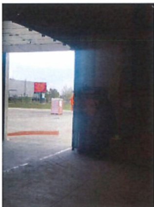
Cladire C1, Depozit parter si spatii birouri P+1