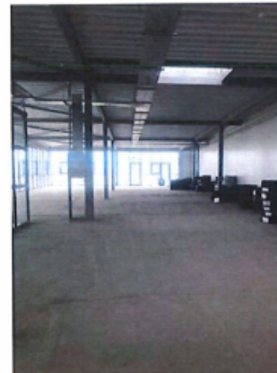
Cladire C1, Depozit parter si spatii birouri P+1