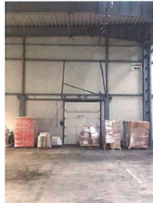
Cladire C1, Depozit parter si spatii birouri P+1