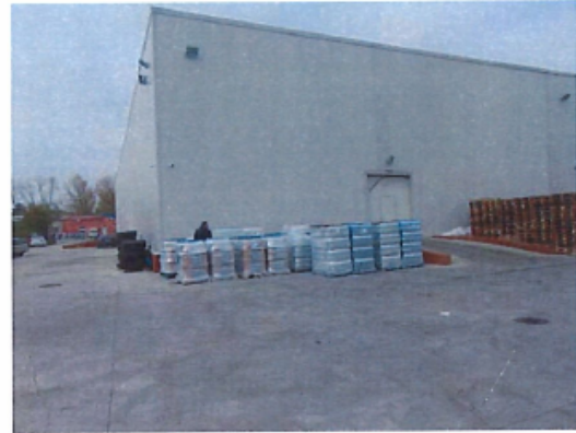
Cladire C2 – Depozit parter