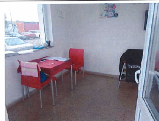
Cladire C3 – Cabina poarta