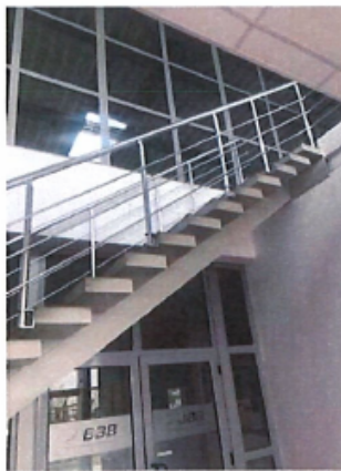
Cladire C1, Depozit parter si spatii birouri P+1