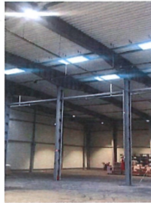
Cladire C1, Depozit parter si spatii birouri P+1