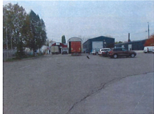
Constructii speciale: platforma betonata si imprejmuiri