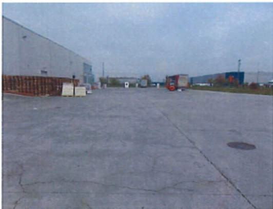
Constructii speciale: platforma betonata si imprejmuiri