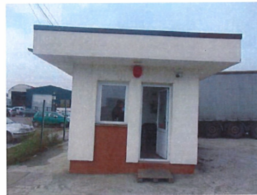
Cladire C3 – Cabina poarta