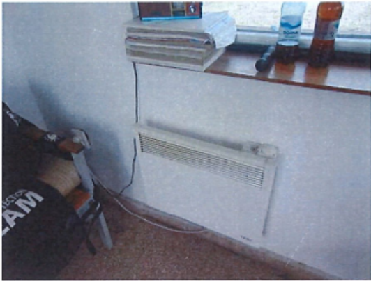
Cladire C3 – Cabina poarta