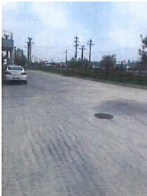
Constructii speciale: platforma betonata si imprejmuiri