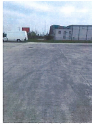
Constructii speciale: platforma betonata si imprejmuiri