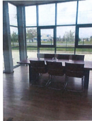
Cladire C1, Depozit parter si spatii birouri P+1